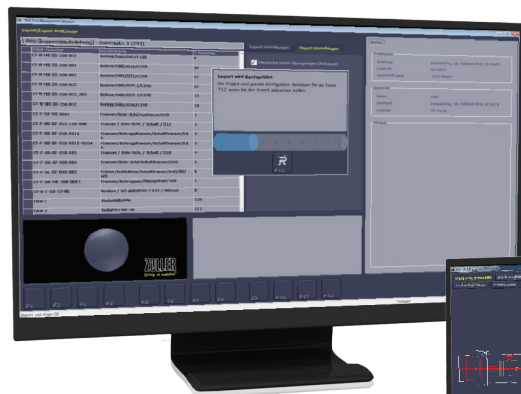
Niezależna platforma do importu i eksportu danych w formacie XML